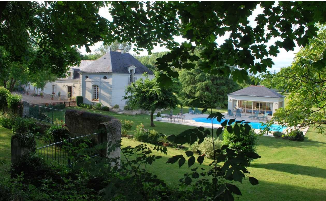
Bed/Breakfast in Saumur