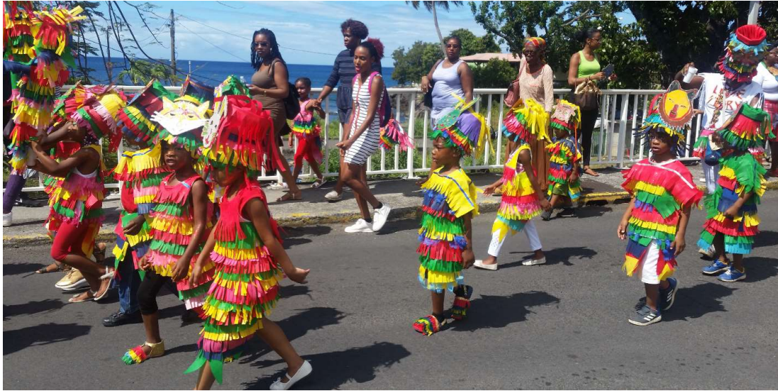
Karneval met kinderen en steelband