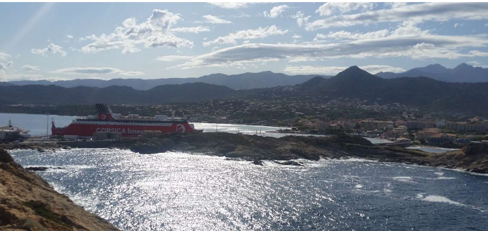
L'Île Rousse, nu ook rookvrij op het strand