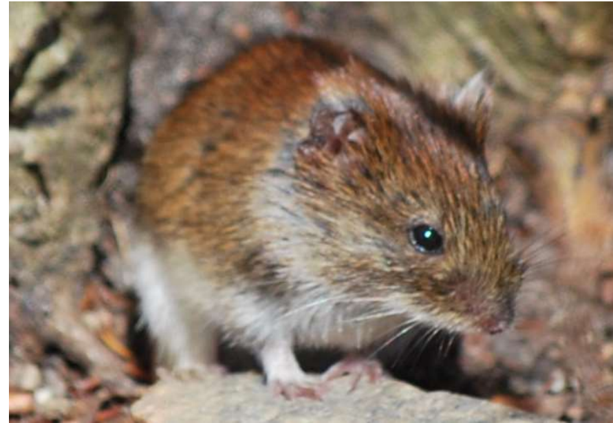
Voorjaar in een "nieuw" bos