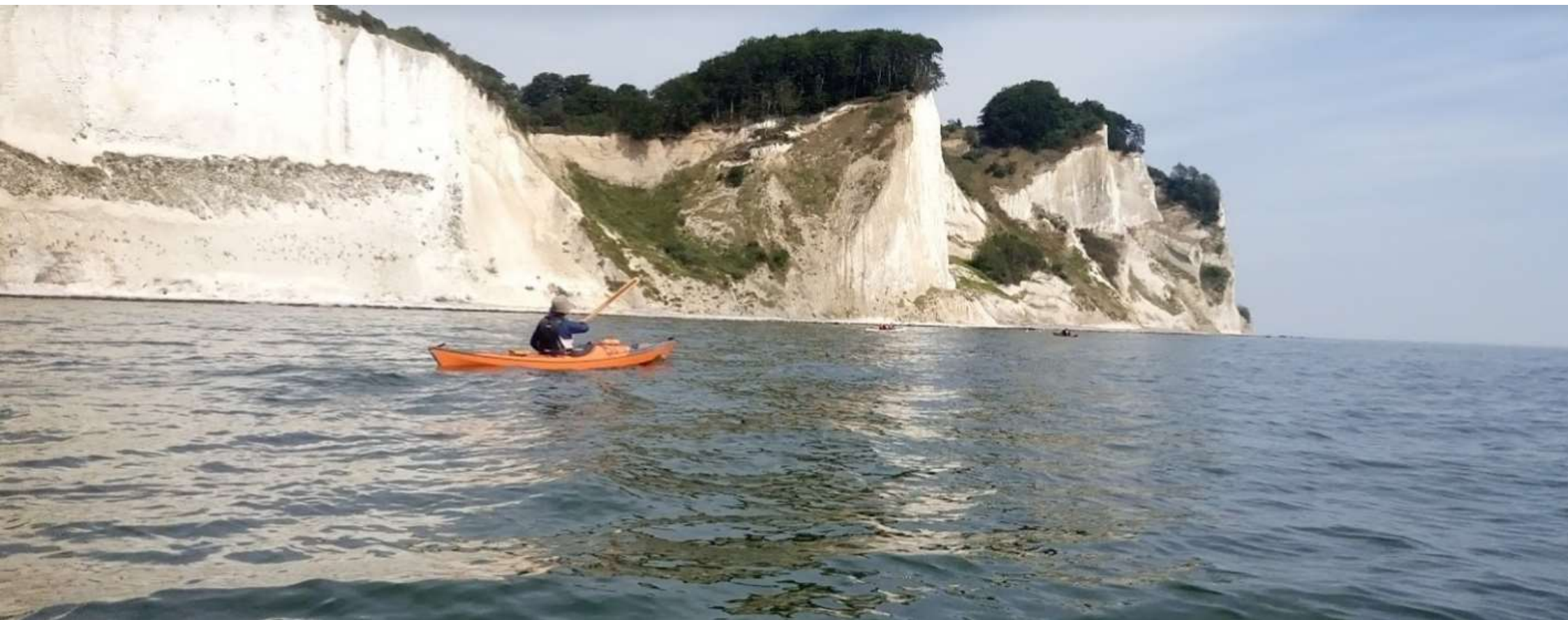
Juli, mooie kust bij Møns Klint