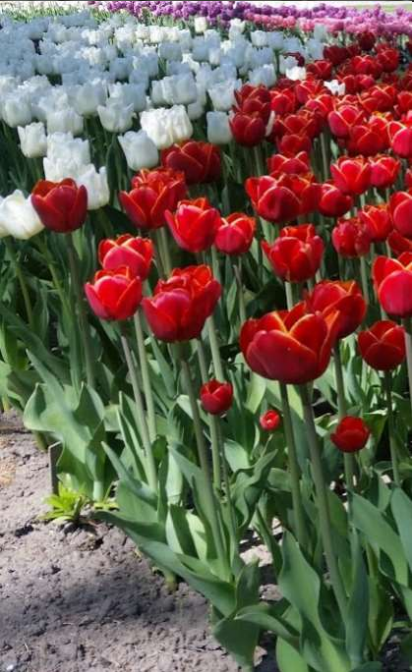
Mei, tulpen bij Gavnø Slot