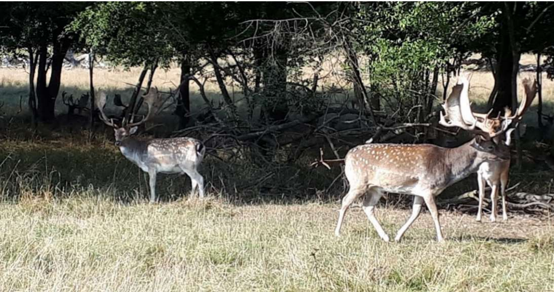
September: Martha was een dagje een beetje "ziek" en we gingen samen op safari in de bossen vlakbij Kopenhagen.