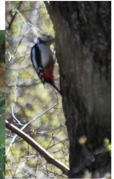
Voorjaar, nu met een eekhoorn en een specht in onze tuin