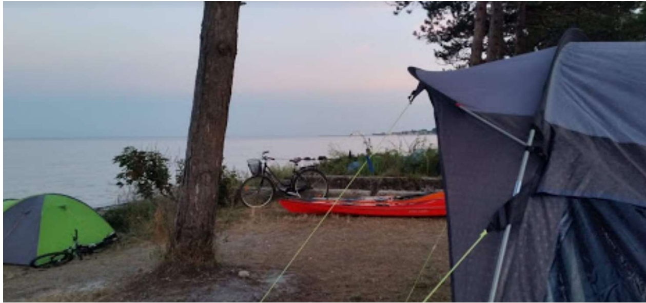
Augustus: we kamperen en roeien een paar dagen op het eiland Samsø