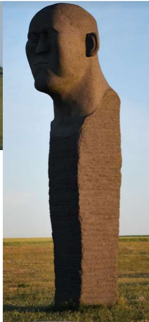
Juni, Dodekalitten bij Kragenæs