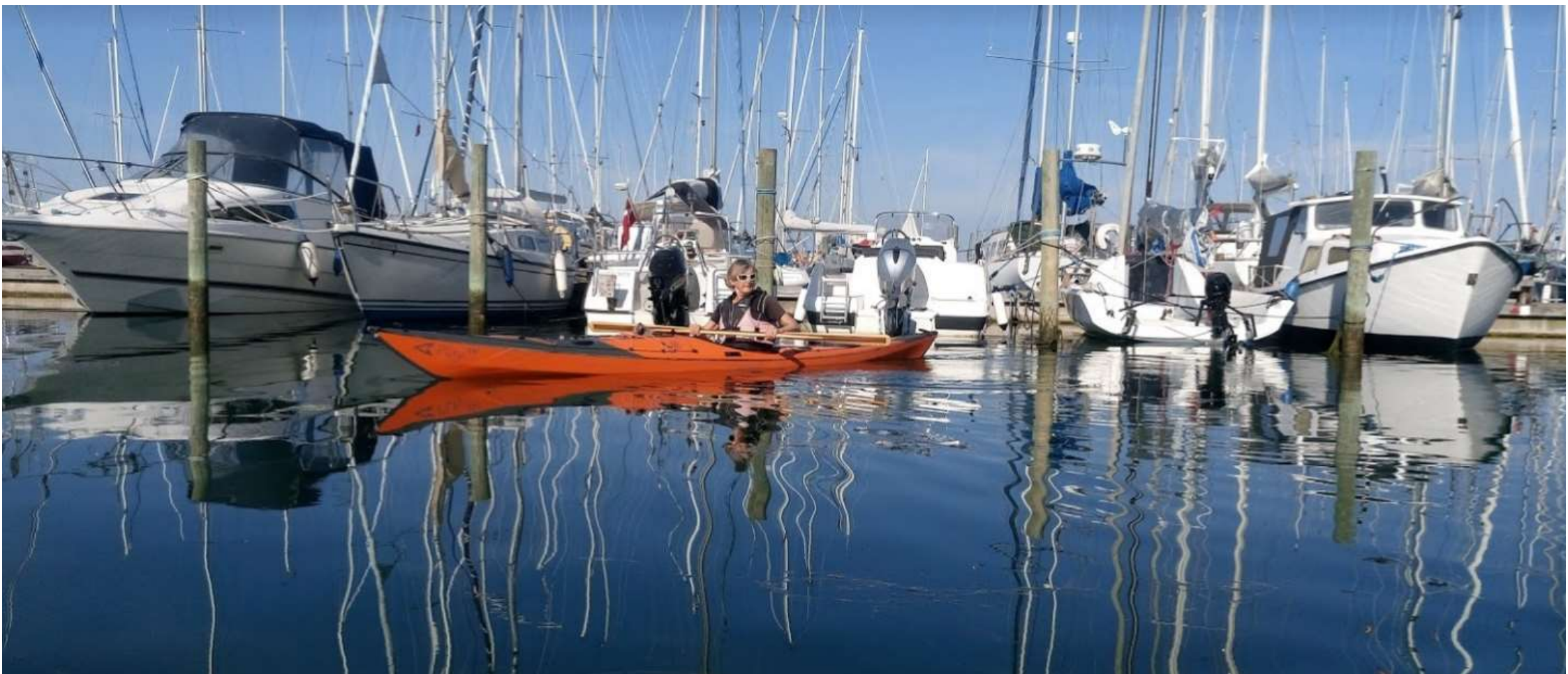
Augustus: Samsø – in de haven van Ballen