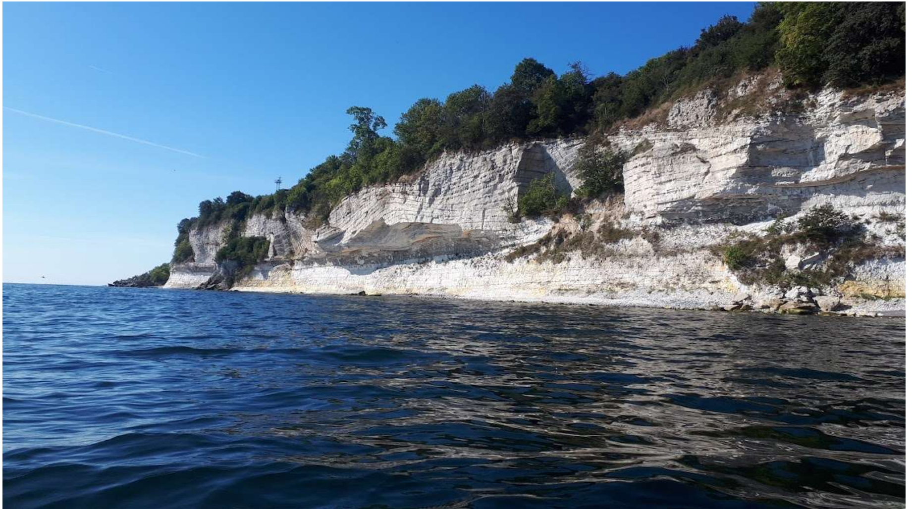
Een dagtocht bij de kust van Stevns Klint (Denemarken)