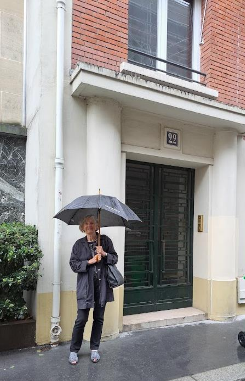
Rue de Pontoise