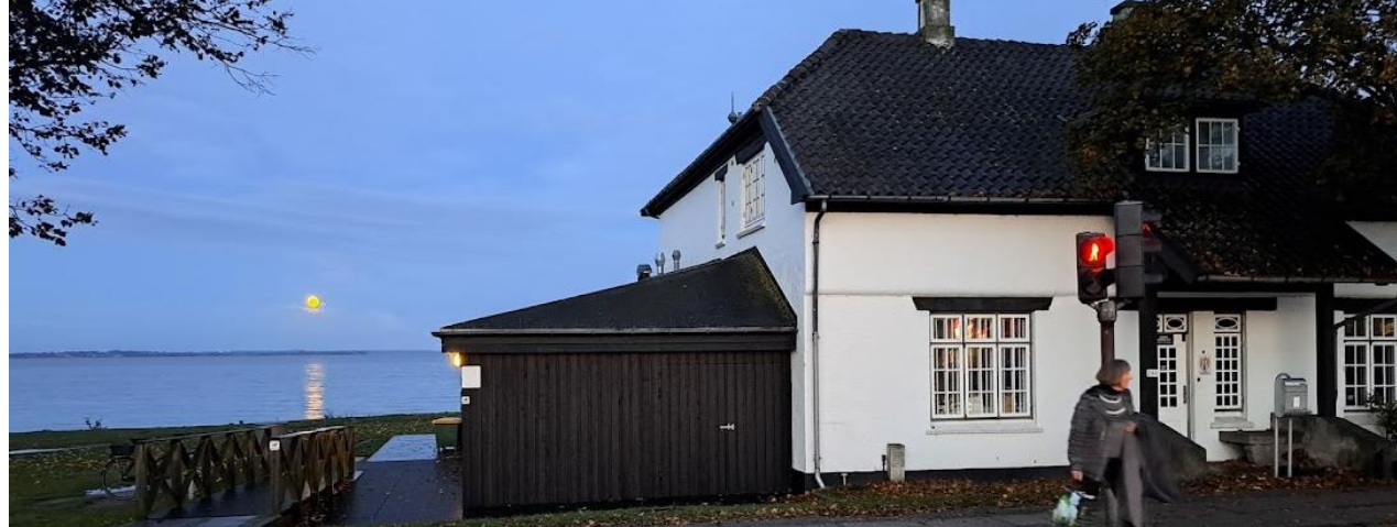
Ons clubhuis van Vedbæk Vikingen.

Nu winterzwemmen we in de zee en vierden de winterzonnewende 2023 in onze nieuwe Viking klub met zang, oesters en champagne.