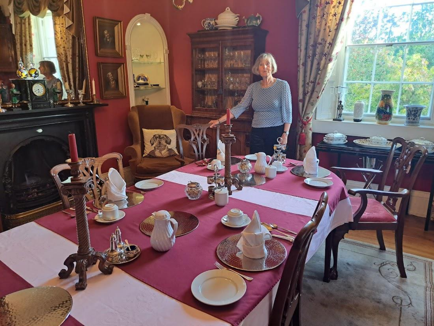
Ontbijt in onze B&B in Bath