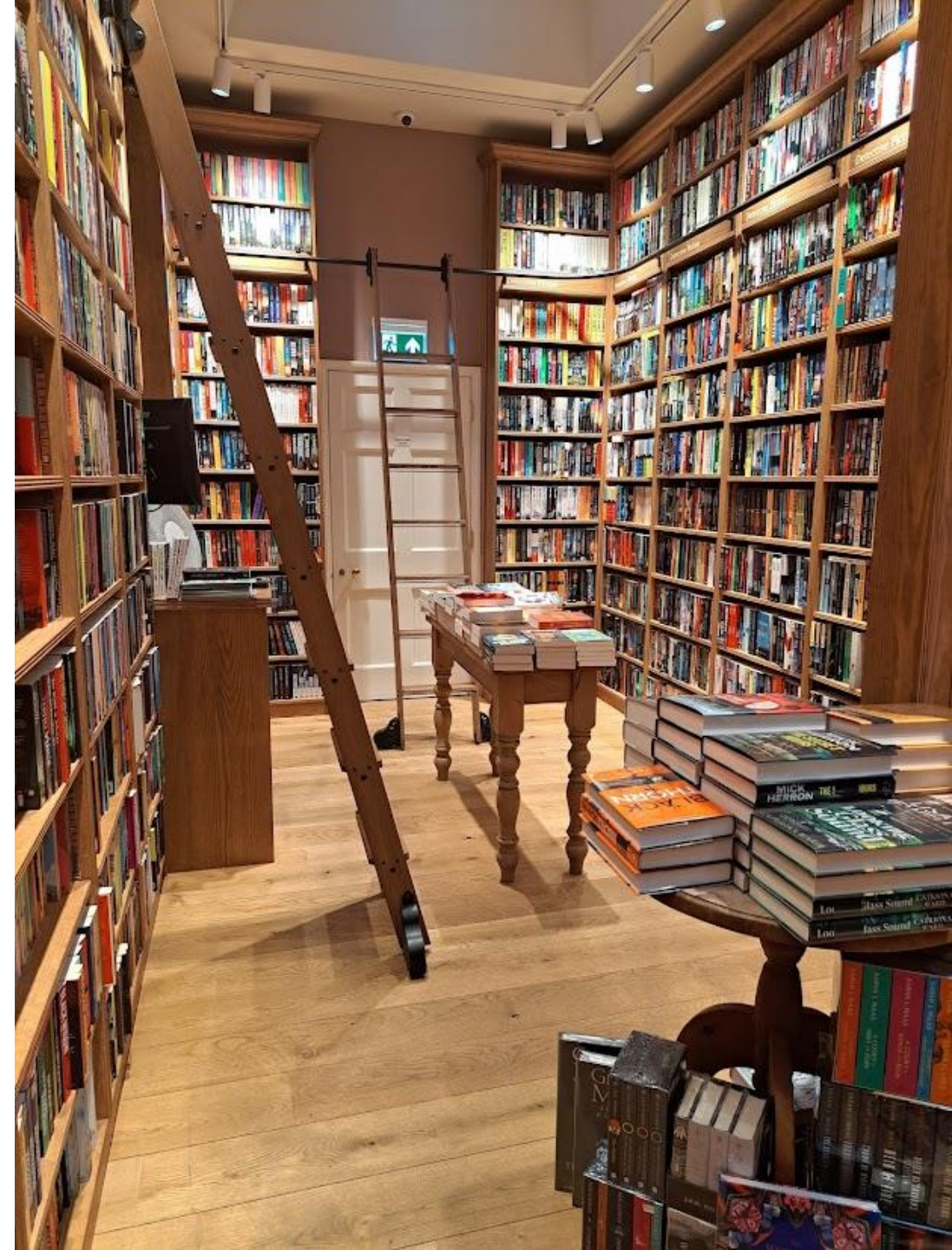
Mooie boekwinkel in Bath