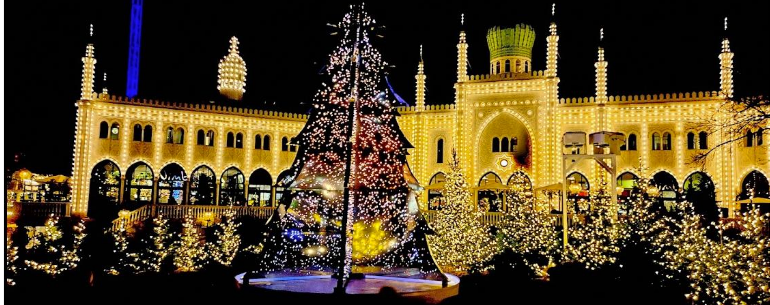
Tivoli in Kopenhagen